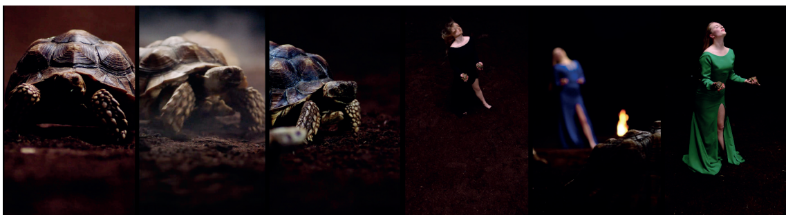
SCHANDE ÜBERS GANZE ERDENREICH!

Les tortues font, depuis les années '70, partie de l'univers de Jan Fabre. Leur structure et leur nature sont un appel à la recherche et à la découverte. Par leur silhouette archaïque et le fait qu'elles réunissent les continents et les éléments naturels, on attribue aux tortues la connaissance de la vérité et la capacité de transmettre les oracles. Jan Fabre les appelle ses 'pierres d'oracle', parce que leur carapace transmet le poids et la mémoire des siècles. La carapace est un objet particulièrement fascinant, qui donne vie aux images oniriques. Les oracles sont lus au travers du langage de sa géométrie et de ses taches de couleur. Elle fut d'ailleurs utilisée pour assister l'Oracle de Delphes.