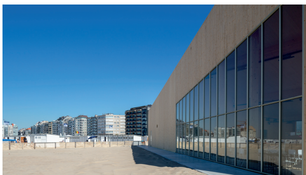
BMW ARTVILLE - G2ARCHITECTEN