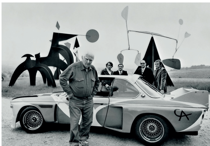
BMW ART CAR BY ALEXANDER CALDER