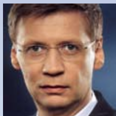
Günther Jauch Showmaster, Journalist und Produzent