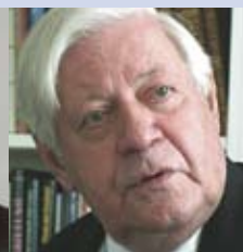
Helmut Schmidt Bundeskanzler a. D., Herausgeber DIE ZEIT