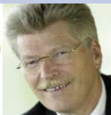
Friedhelm Loh Bundesverband der Deutschen Industrie