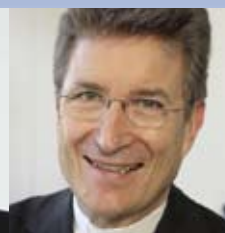
Bischof Dr. Dr. h. c. Wolfgang Huber Evangelische Kirche Berlin-Brandenburg- schlesische Oberlausitz