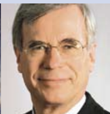
Dr. Michael Otto Otto Group