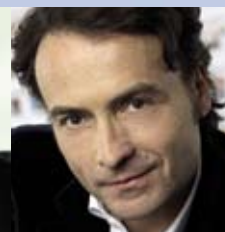
Giovanni di Lorenzo DIE ZEIT