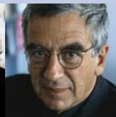
Michael Naumann DIE ZEIT