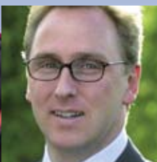
Heinrich Deichmann Heinrich Deichmann- Schuhe GmbH & Co. KG