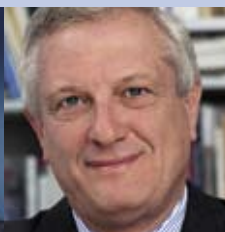
Josef Joffe DIE ZEIT