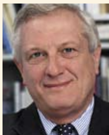
Josef Joffe Herausgeber DIE ZEIT

Sehr geehrte Damen und Herren, liebe Gäste,