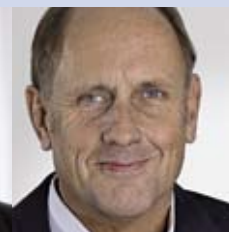
Hans-Joachim Stuck Rennfahrer und Formel-1-Experte

Konferenz für die Entscheider von heute und morgen. Diskutieren Sie mit herausragenden Persönlichkeiten aus Wirtschaft, Wissenschaft, Publizistik und Politik.