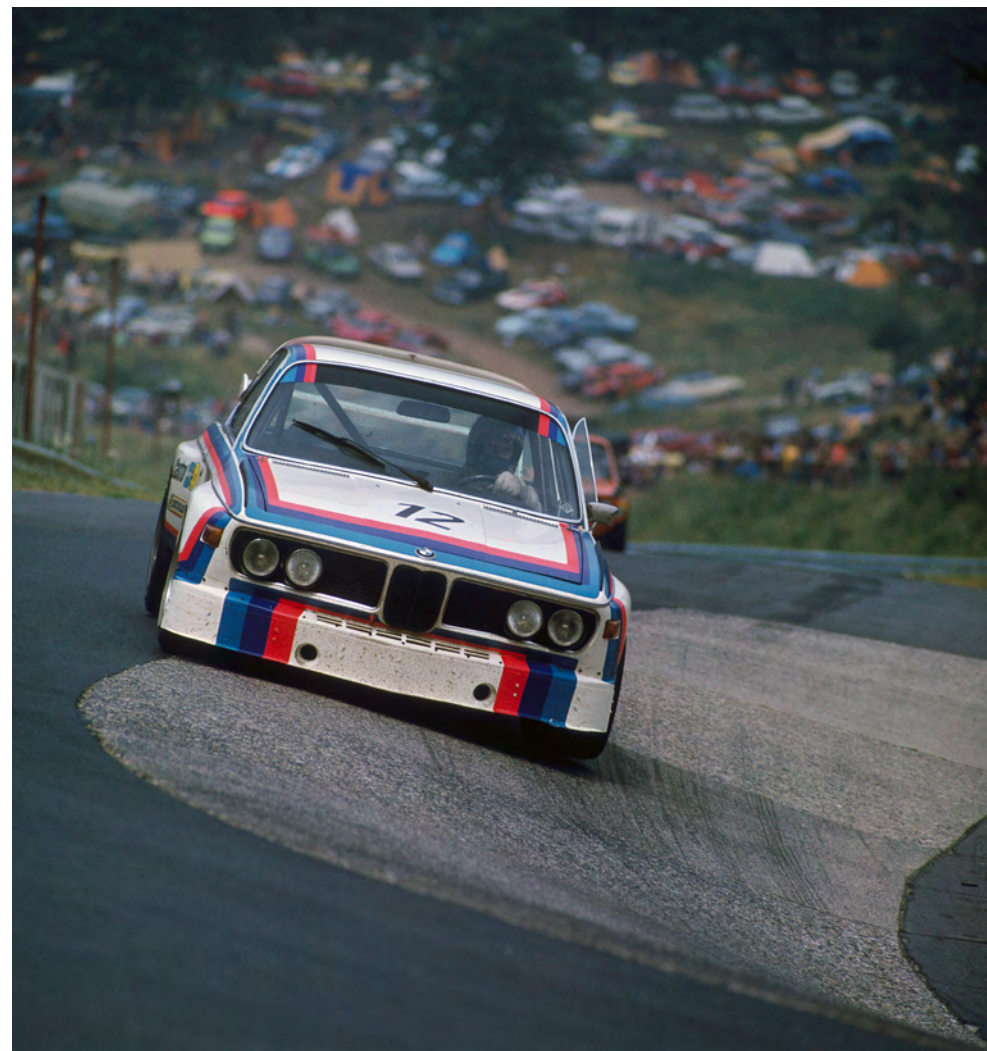
BMW MOTORSPORT – 24 STUNDEN AUF DEM NÜRBURGRING 2015.