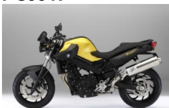
N66 Jaune brillant /Noir brillant