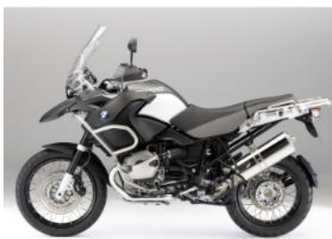
M11 Gris fumé mat métal