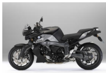
N71 Noir brillant / Gris granit métal