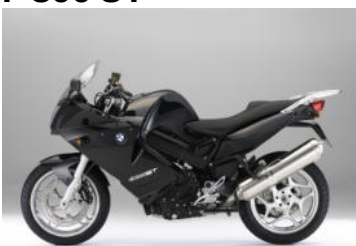
N43 Noir saphir métal / Noir saphir métal