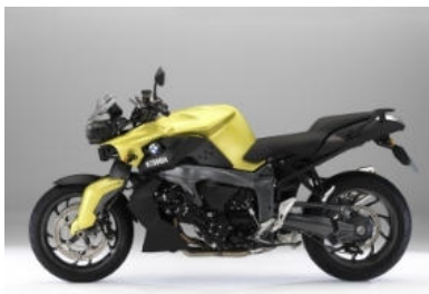
N70 Vert acide métal / Noir brillant