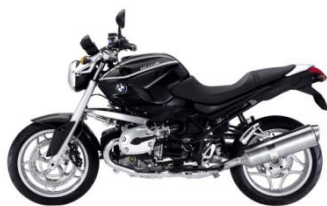
730 Noir uni avec liseré blancs