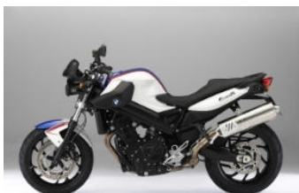
N80 Blanc alpin / Bleu métal /Rouge magma « Motorsport »