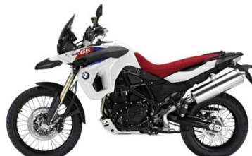
N74 30 ans de GS