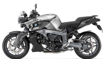
N38 Blanc métal