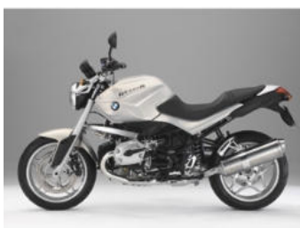
751 Blanc alpin