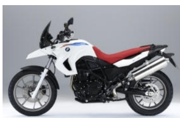
N74 30 ans de GS