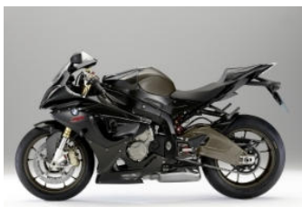
N44 Gris orage métal