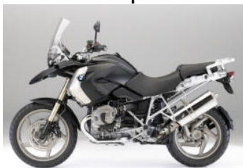
N43 Noir saphir métal