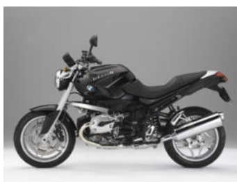
716 Noir uni