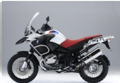
N74 30 ans de GS