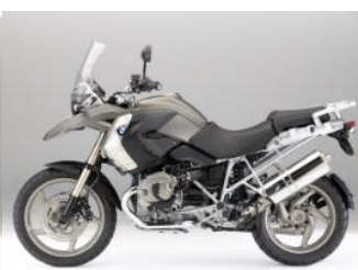
N50 Beige métal mat