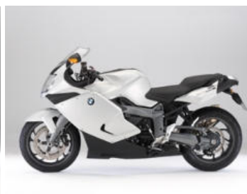
N38 Blanc métal /Noir saphir métal