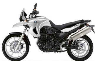
924 Blanc aluminium mat