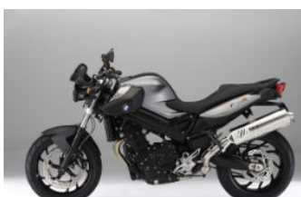
N67 Gris granit métal /Noir brillant