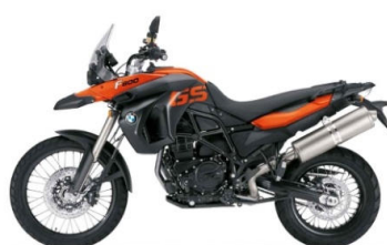
N24 Orange lave / Soie noire