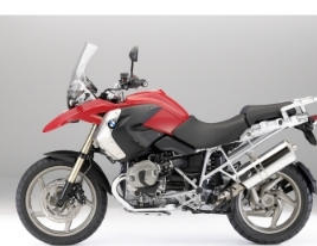
715 Rouge magma