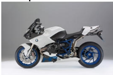
751 Blanc alpin uni