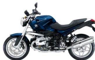
847 Bleu Biarritz métal