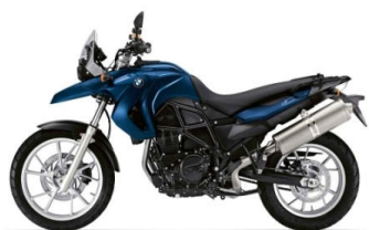
847 Bleu Biarritz métal