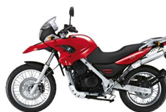
761 Rouge uni