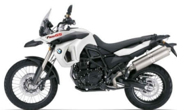
751 Blanc alpin