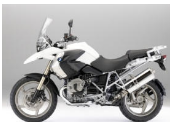
751 Blanc alpin