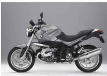
N10 Gris granit métal