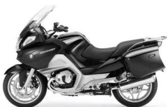
N44 Gris orage métal