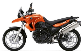
N42 Orange lave métal