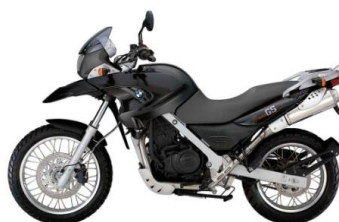
715 Noir profond uni