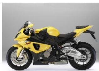
N03 Jaune brillant