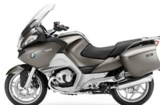
N50 Beige métal mat