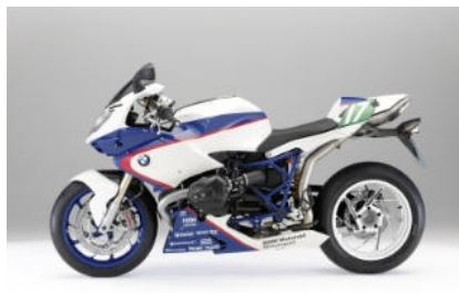
N58 Coloris Motorsport Replica