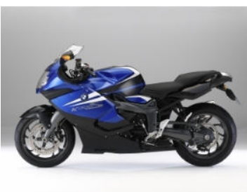
N68 Bleu métal /Blanc alpin