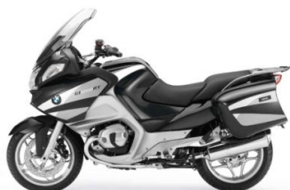
N49 Gris orage métal / Argent titane métal / Gris granit métal