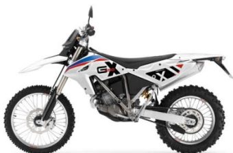
N57 Blanc Racing