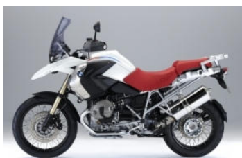
N74 30 ans de GS