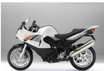
N65 Gris clair métal / Gris granit métal