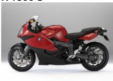
N69 Rouge magma /Noir saphir métal