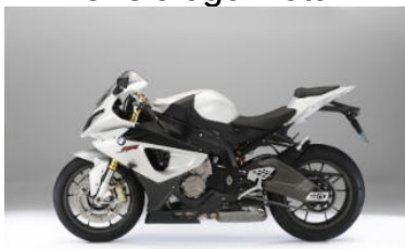
N73 Gris clair métal