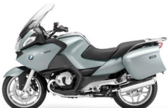
N48 Gris polaire métal