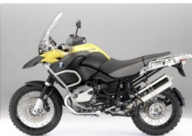
N03 Jaune brillant