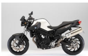
N07 Blanc alpin /Soie noire