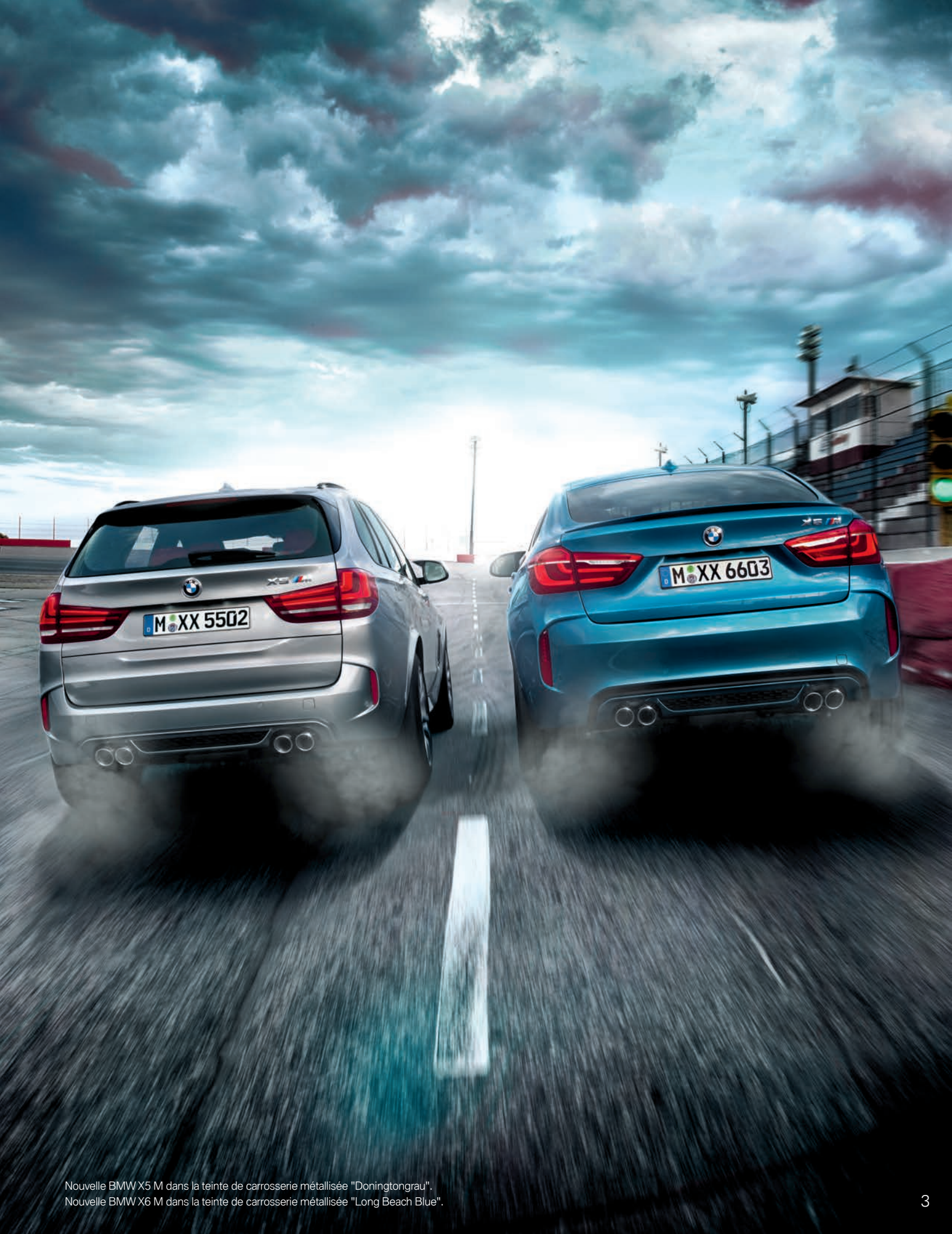
Nouvelle BMW X5 M dans la teinte de carrosserie métallisée "Doningtongrau". Nouvelle BMW X6 M dans la teinte de carrosserie métallisée "Long Beach Blue".