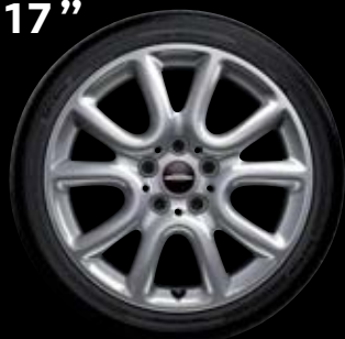
"RACE SPOKE" SILVER