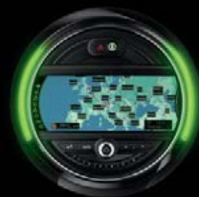
► SYSTÈME DE NAVIGATION

Une connexion Internet haut débit est nécessaire. Les frais supplémentaires en résultant [dus par exemple à l'itinérance des données] font partie du contrat signé entre le client et son fournisseur d'accès. L'application MINI Connected peut être téléchargée gratuitement sur la boutique d'applications du fournisseur de périphériques multimédias (exigences et conditions spécifiques au pays à respecter). Possibilité de mise à jour de l'application MINI Connected sans supplément de prix. Les extensions peuvent être payantes. Pour de plus amples informations notamment sur la compatibilité des périphériques multimédias, rendez-vous sur MINI.com/connectivity .