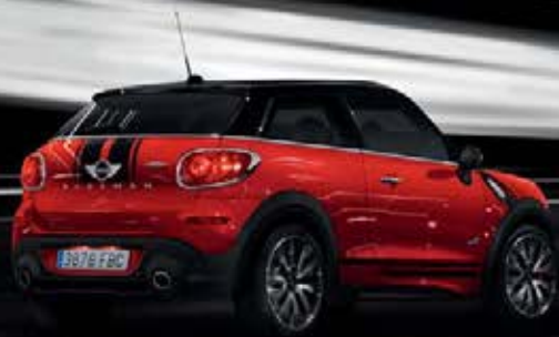
MINI PACEMAN JOHN COOPER WORKS.