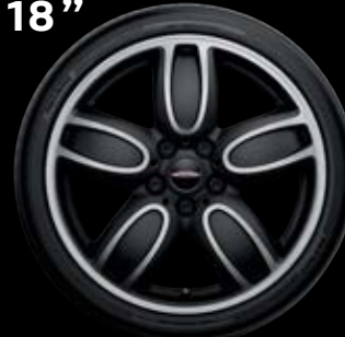
"CUP SPOKE" BICOLORES