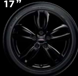
"TRACK SPOKE" NOIRES