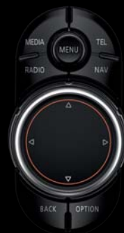
► MINI TOUCH CONTROLLER Niveau 2