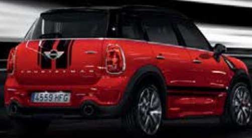
MINI COUNTRYMAN JOHN COOPER WORKS.