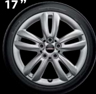
"TRACK SPOKE" SILVER