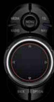
► MINI TOUCH CONTROLLER Niveau 2

1 900 € SOIT 45 € / MOIS SANS APPORT (1)