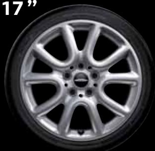
"RACE SPOKE" SILVER