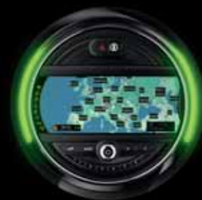
► SYSTÈME DE NAVIGATION

Une connexion Internet haut débit est nécessaire. Les frais supplémentaires en résultant [dus par exemple à l'itinérance des données] font partie du contrat signé entre le client et son fournisseur d'accès. L'application MINI Connected peut être téléchargée gratuitement sur la boutique d'applications du fournisseur de périphériques multimédias (exigences et conditions spécifiques au pays à respecter). Possibilité de mise à jour de l'application MINI Connected sans supplément de prix. Les extensions peuvent être payantes. Pour de plus amples informations notamment sur la compatibilité des périphériques multimédias, rendez-vous sur MINI.com/connectivity .