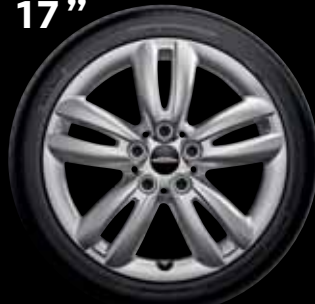
"TRACK SPOKE" SILVER