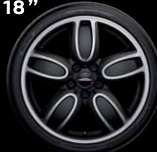
"CUP SPOKE" BICOLORES