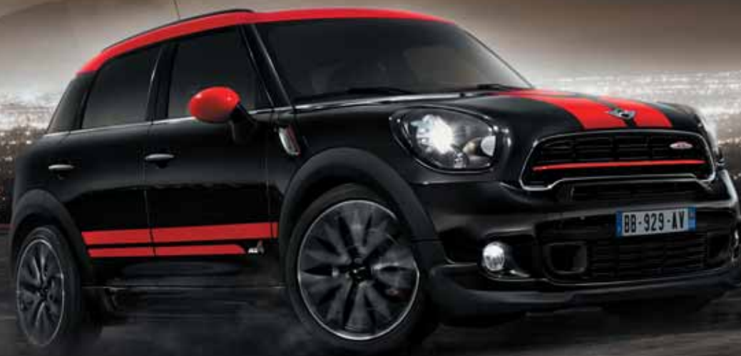
MINI JOHN COOPER WORKS COUNTRYMAN.

IL N'Y A PAS QUE LA MINI 3 QUI A UN CARACTÈRE BIEN