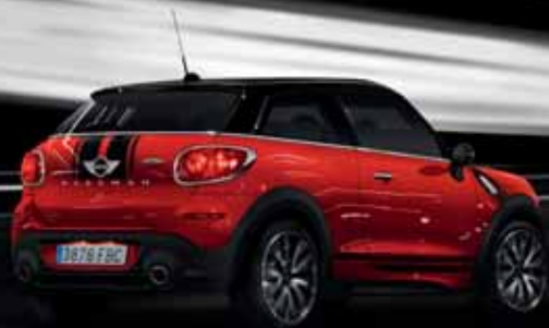
MINI JOHN COOPER WORKS PACEMAN.