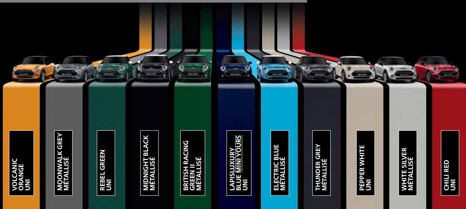
VOLCANIC ORANGE UNI