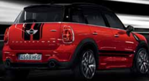
MINI JOHN COOPER WORKS COUNTRYMAN.