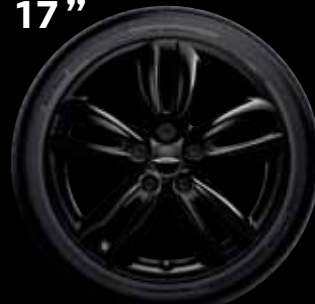
"TRACK SPOKE" NOIRES