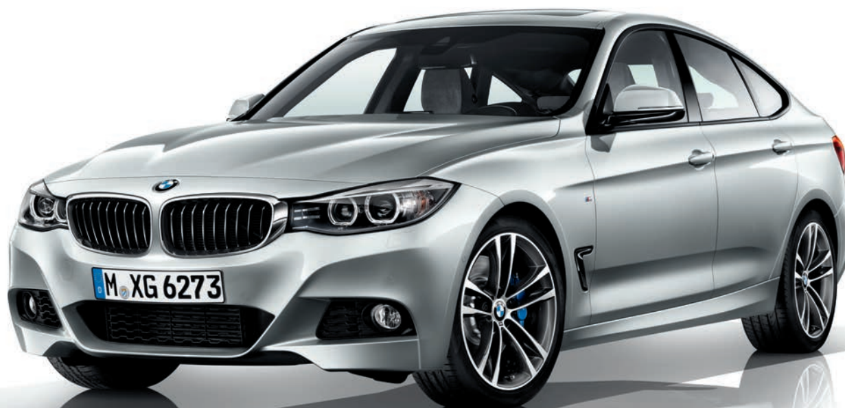
BMW Série 3 Gran Turismo M Sport dans la teinte de carrosserie métallisée optionnelle "Glaciersilber", jantes en alliage léger 19" optionnelles.