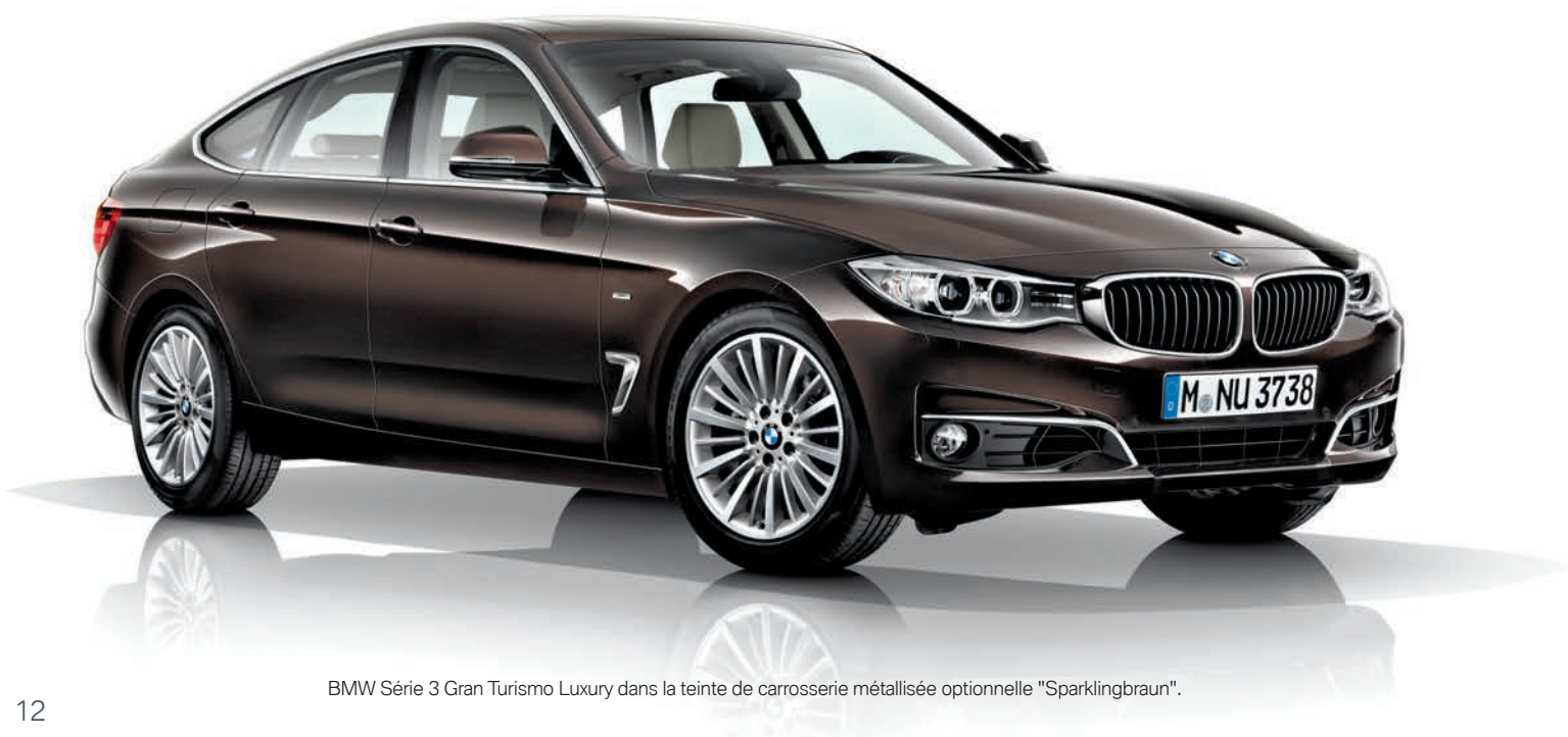
BMW Série 3 Gran Turismo Luxury dans la teinte de carrosserie métallisée optionnelle "Sparklingbraun".

* Selon votre choix, à mentionner lors de la commande.