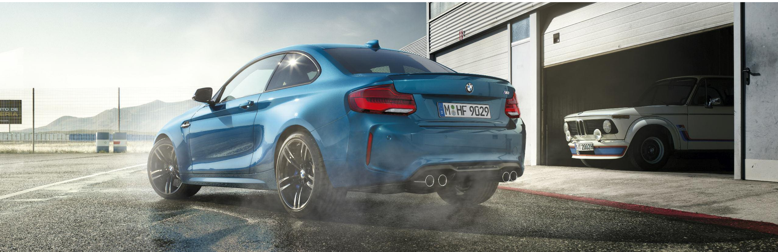
BMW M2 Coupé dans la teinte de carrosserie métallisée "Long Beach Blue" optionnelle.

*Exemple de loyer pour une BMW M2 370 ch Coupé en Location Longue Durée sur 36 mois et pour 30 000 km intégrant l'extension de garantie. 36 loyers linéaires de 1029,80 €/mois hors assurances facultatives. Offre réservée aux particuliers valable pour toute commande d'une BMW M2 370 ch Coupé jusqu'au 31/03/2018 dans les concessions BMW participantes. Sous réserve d'acceptation par BMW Finance. SNC au capital de 87 000 000 €. RCS Versailles B 343 606 448. TVA FR 65 343 606 448. Etablissement de Crédit Spécialisé agréé par l'Autorité de Contrôle Prudentiel et de Résolution sous le n°14670. Courtier en Assurances immatriculé à l'ORIAS sous le n°07 008 883. Vérifiable sur www.orias.fr . Consommation en cycle mixte : 8,5 l/100 km. CO 2 : 199 g/km selon la norme Européenne NEDC. L'extérieur de ce véhicule comporte des équipements de série ou en option en fonction de la finition.