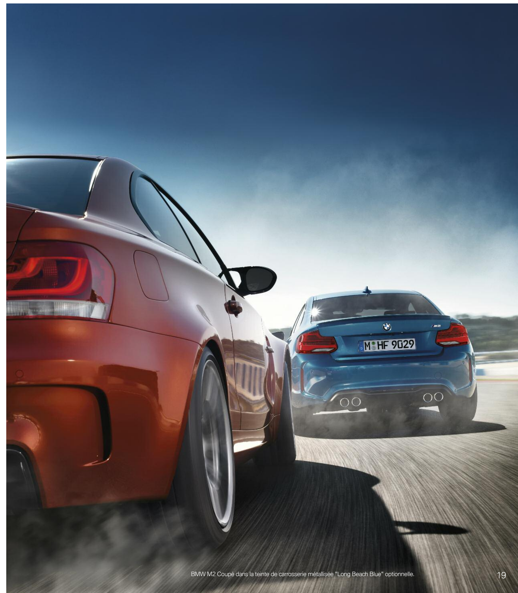
BMW M2 Coupé dans la teinte de carrosserie métallisée "Long Beach Blue" optionnelle.