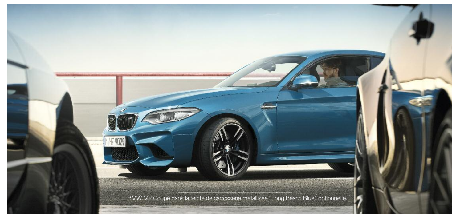
BMW M2 Coupé dans la teinte de carrosserie métallisée "Long Beach Blue" optionnelle.