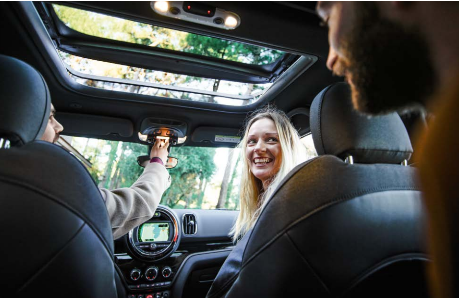
Toit ouvrant panoramique en verre

MINI COOPER SD ALL4 190 CH 44 900 € soit 670 €/MOIS (1)