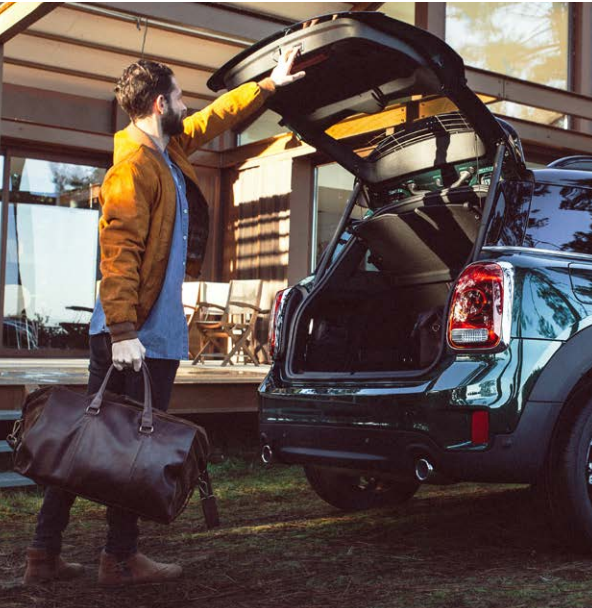
Commande électrique du hayon