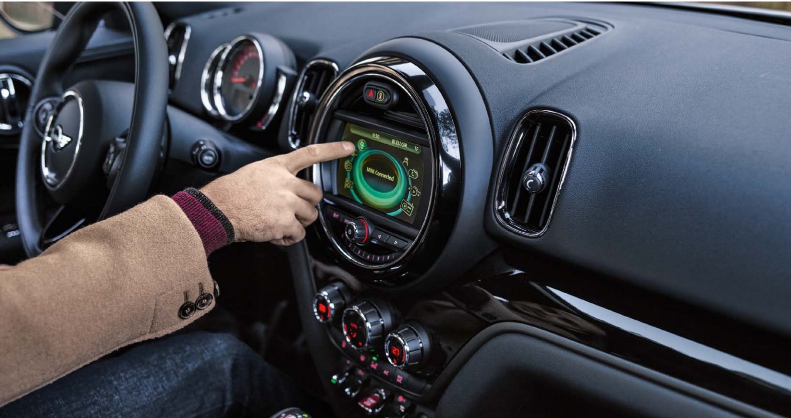
Pack Connected Navigation

Prix T.T.C. maximum conseillés au 01/02/2018..