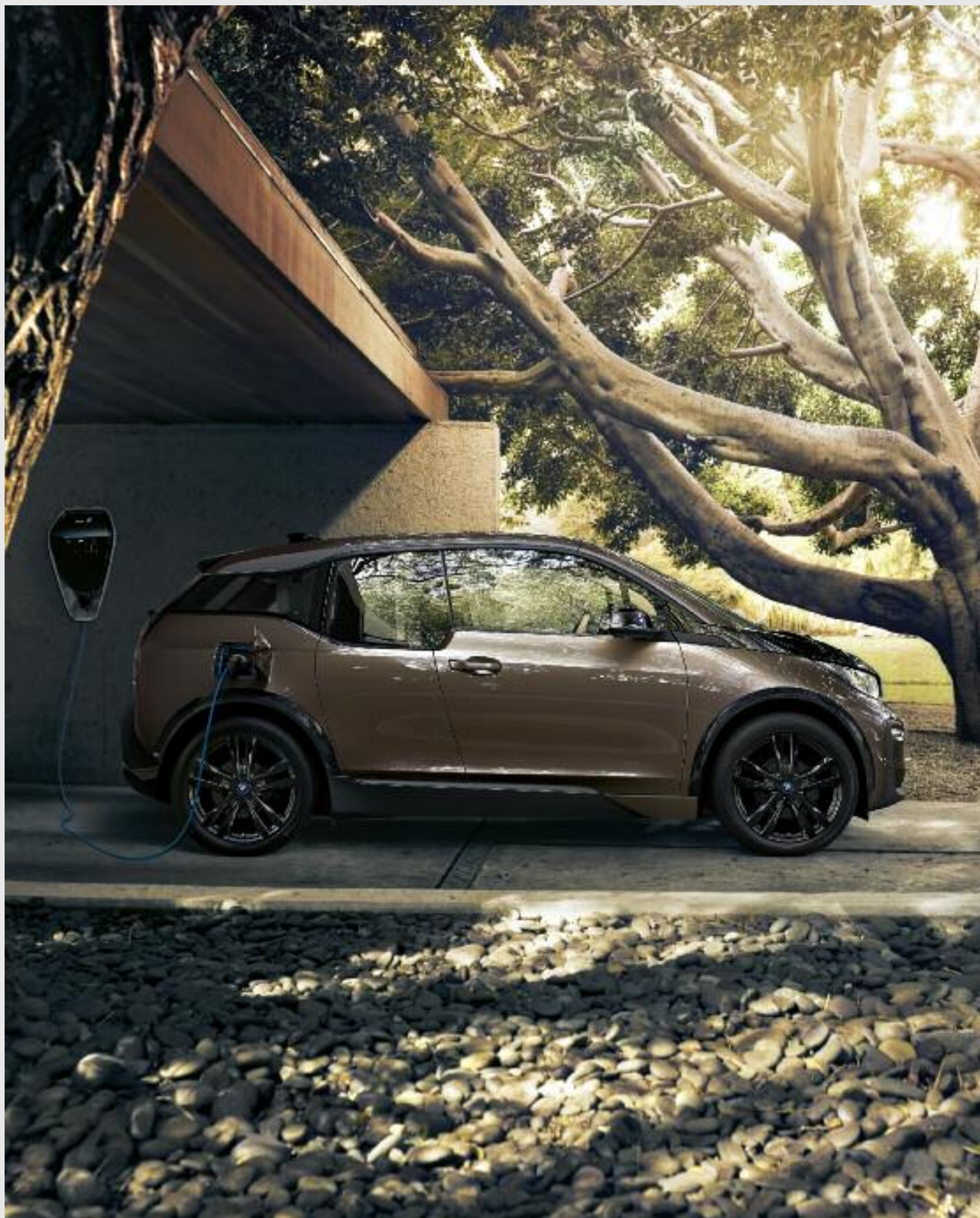
NOUVELLES BMW i3 ET i3S 120 Ah.