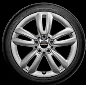
John Cooper Works "Track Spoke" Silver