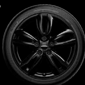
John Cooper Works "Track Spoke" Noires