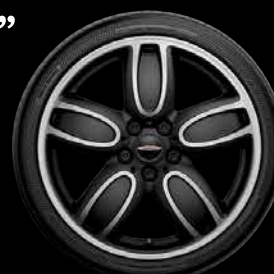
John Cooper Works "Cup Spoke" Bi-ton