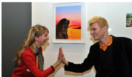
Mazaccio & Drowilal « Wild Style », Résidence BMW 2013 Lauréats 2022 du Prix 1% marché de l'art