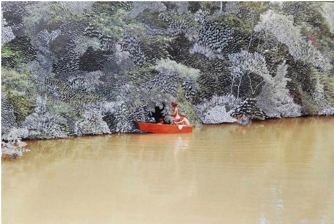
Cueillir les murmures

Paris, 16 mai - Cette édition 2025 est donc toute particulière. Elle présente d'une part l'exposition inédite « Traversée du fragment manquant » , de l'artiste Raphaëlle Peria et la curatrice Fanny Robin , duo lauréat du programme de mécénat BMW ART MAKERS et marque également 15 ans d'un partenariat artistique et culturel durable avec les Rencontres d'Arles .