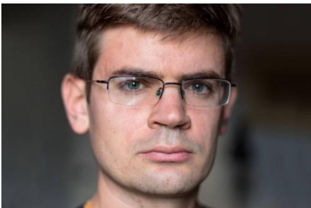
Lewis Bush "Ways of Seeing Algorithmically", Résidence BMW 2019

Lauréat British Journal of Photography International Photography Award 2021.