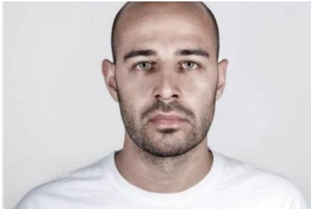
Emeric Lhuisset « Quand les nuages parleront », Résidence BMW 2018

Lauréat British Journal of Photography International Photography Award 2021.