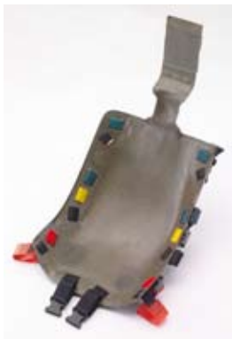
碳纤维混合纤维座位: 使用平行保险带系统。

Formula BMW 是全球第一项采用头颈保护装置 (Head and Neck Support System) 的入门级比赛。当发生碰撞, 这项设备能防止头部承受过多的冲击, 与方程式救援座椅配合得天衣无缝。就算是 F1 的高水平赛事也认同头颈保护装置的好处, 并强制车手使用。