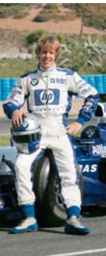
前途无量: Sebastian Vettel

若要数历来成绩最突出的 Formula BMW 参赛者,当然非 Sebastian Vettel 莫属。这位生于德国 Heppenheim 的十八岁选手在二零零三年的 Formula BMW ADAC Championship 获得新秀杯冠军,继而在二零零四年度的比赛以无敌的姿态封王,胜出二十场比赛中的十八场。得到 BMW 和红牛的大力支持,他在二零零五年开始参加欧洲三级方程式大赛。在一次访问中,Sebastian 谈及他的赞助商、试开F1跑车的经验和未来的计划。