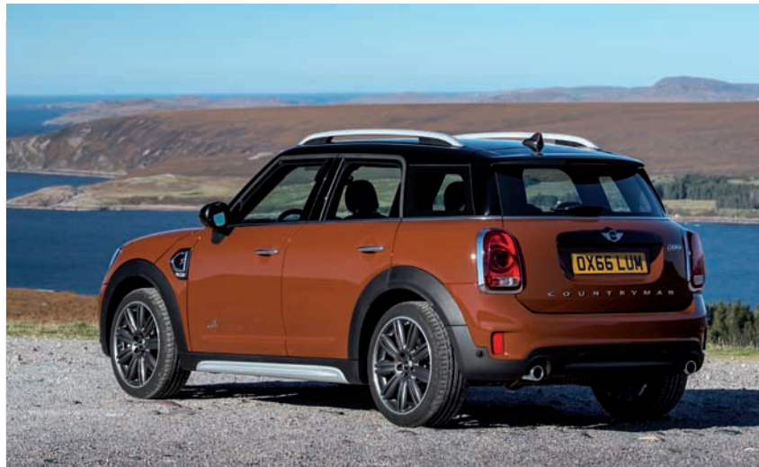
P90240532.jpg / P90240653.jpg

de aluminio satinado se combina con esmaltados de la talonera en color plata. Esto resalta la altura del vehículo adicionalmente desde el punto vista óptico. En la zaga predominan las líneas horizontales que crean un atractivo contraste con las unidades de luces de disposición vertical.