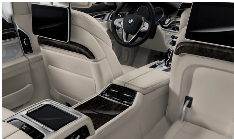
Mostantól beszédvezérlés, érintőképernyő, valamint gesztusvezérlés egészíti ki a még tovább tökéletesített BMW iDrive rendszert.