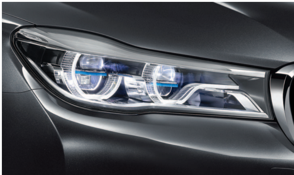
Lézer modul a távolsági fényszórókban, mely megduplázza a Bi-LED fényszórók fényerősségét.