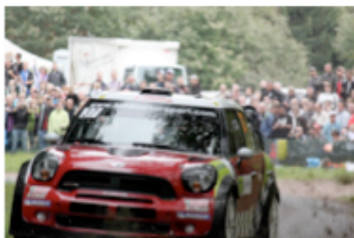
2012 – MINI ufficiale impegnata nel Rally d'Alsazia

Castrol e MINI uniscono le loro forze per lo sviluppo di lubrificanti formulati insieme, allo scopo di fornire a tutti i guidatori di MINI il massimo delle prestazioni.