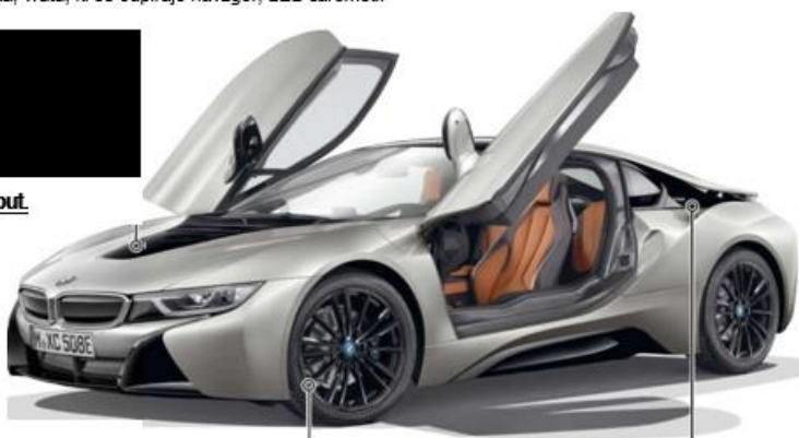
Nova 20-palčna platišča (dodatna oprema).