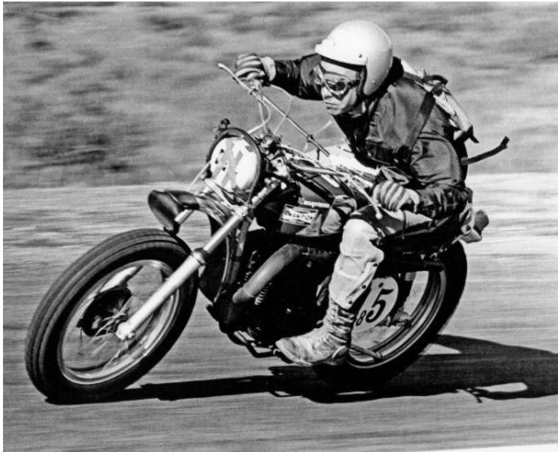
Malcolm Smith, legendario piloto americano de Husqvarna

Se cumplen cuatro años desde que BMW Group compró Husqvarna Motorcycles. Desde entonces ha habido numerosos cambios; quizá el más significativo de ellos es el anuncio de que la compañía entrará en el mercado de motocicletas de carretera, gracias a la ayuda técnica y el apoyo de la compañía matriz, BMW.