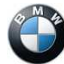
Imagen exclusiva gracias a la perfecta combinación de colores y superficies.

La imagen estética, la elegancia y el carácter exclusivo de la nueva K 1600 GTL Exclusive se deben también a la óptima combinación de colores y de piezas cromadas.