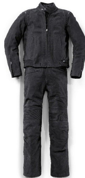
P90312307: Traje Atlantis de BMW Motorrad (2018)