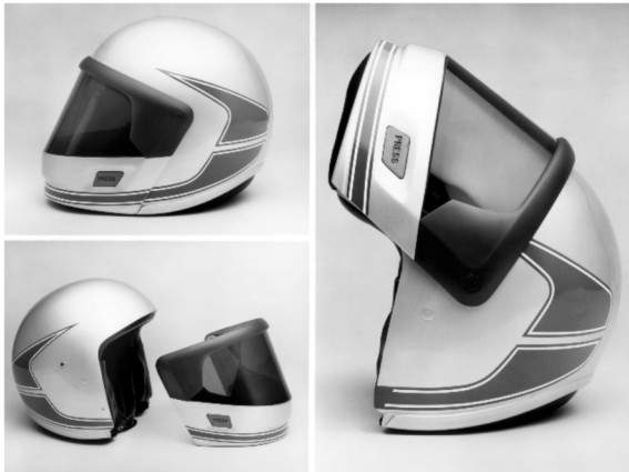
P90312316: Casco System I de BMW Motorrad (1981)

novedad a escala mundial que estableció nuevas referencias en el ámbito del motociclismo. En 2018, el casco System 7 Carbon es lo más destacado de la actual gama de equipamientos para motoristas. Puede transformarse con gran facilidad de un casco System a un casco jet, sin dejar de cumplir las normativas más estrictas en materia de seguridad, aerodinámica y versatilidad.