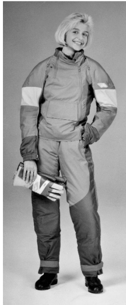
P90312309: Traje Gore-Tex de BMW Motorrad (1989)