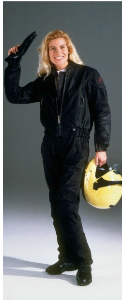
P90312306: Traje Atlantis de BMW Motorrad (1995)