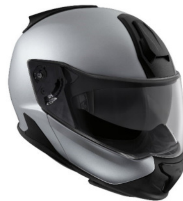
P90312310: Casco System 7 Carbon de BMW Motorrad (2017)