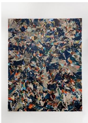
6. Taxio Ardanaz Ruiz “Mendia eta Gaua/ Montaña y noche” (Pamplona, 1978)