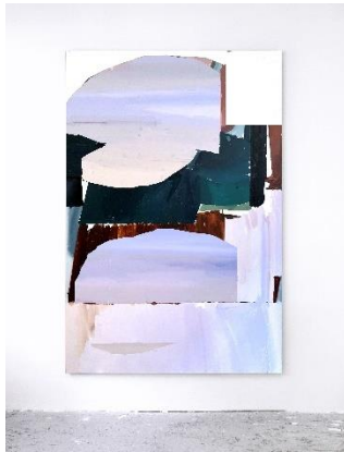
4. Victor Gonzalez “Intro” (Jerez de la Frontera, 1996)